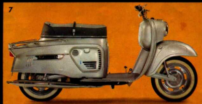
7 Roller 50

Mobile Europäer schlängeln sich überall durch: Rot... kurzer Stop, ganz vorn an der Ampel... Gelb... Grün... jetzt nichts wie raus aus dem Gewühl (...mobile Mädchen mögen das!).